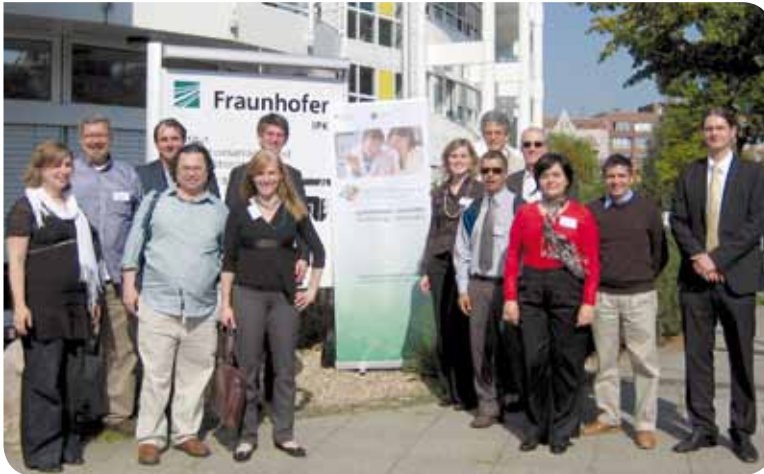
Die brasilianische Delegation besuchte verschiedene Einrichtungen der Fraunhofer Gesellschaft

73 % der benötigten Energieressourcen. Die Wissenschaftler waren sich einig, dass nur mit Erneuerbaren Energien die Energieversorgung langfristig gesichert werden kann. Hier profitierten deutsche und brasilianische Experten vom Austausch untereinander.