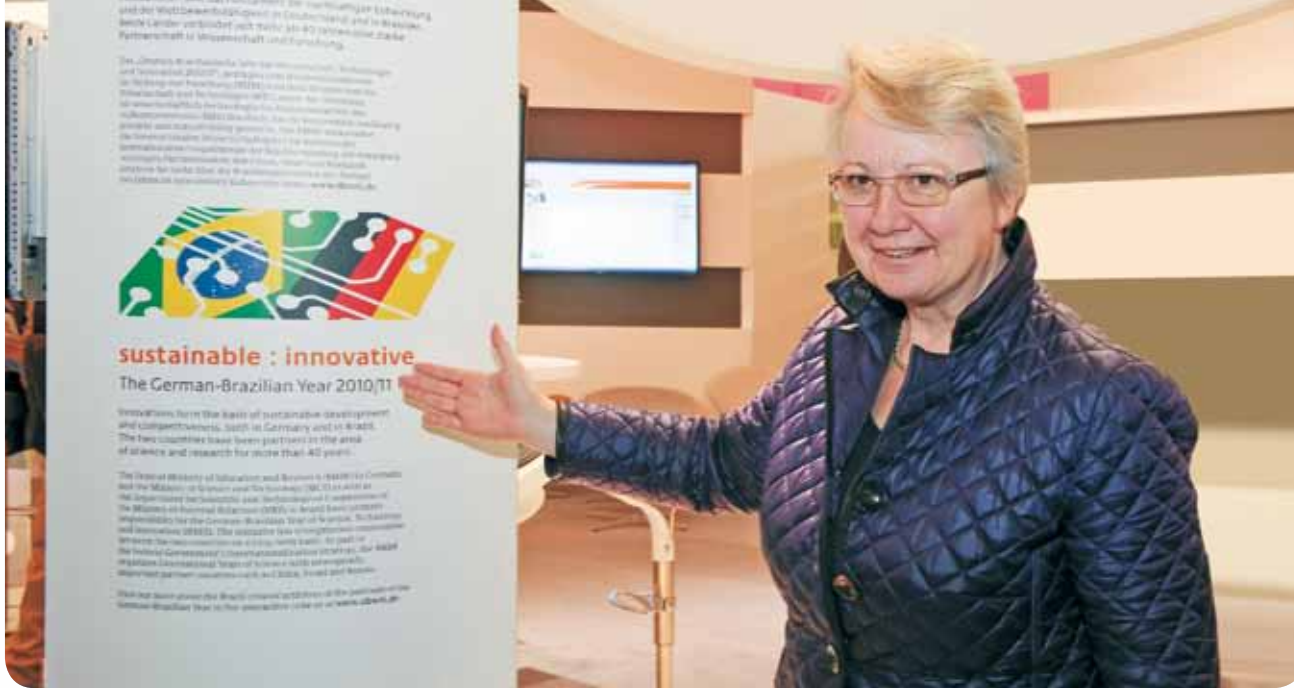
Bundesministerin Schavan präsentiert das Deutsch-Brasilianische Jahr auf der CeBIT.

Intelligence GmbH sowie der Hasso-Plattner-Institut für Softwaresystemtechnik GmbH. Bei all diesen Stationen lernten die Besucher nicht nur den Stand der deutschen Forschung sowie deren Forschungsnetzwerke kennen, sondern konnten zudem persönliche Kontakte für potenzielle Kooperationen aufbauen und Expertengespräche führen.