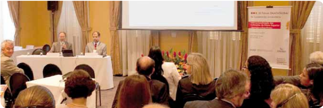
Ein Vortrag im Rahmen der GATE-Tour

Das Format eines zeitlich gestaffelten Gesprächsrasters fand viel Lob und gab die Gelegenheit zu über hundert Einzelgesprächen.