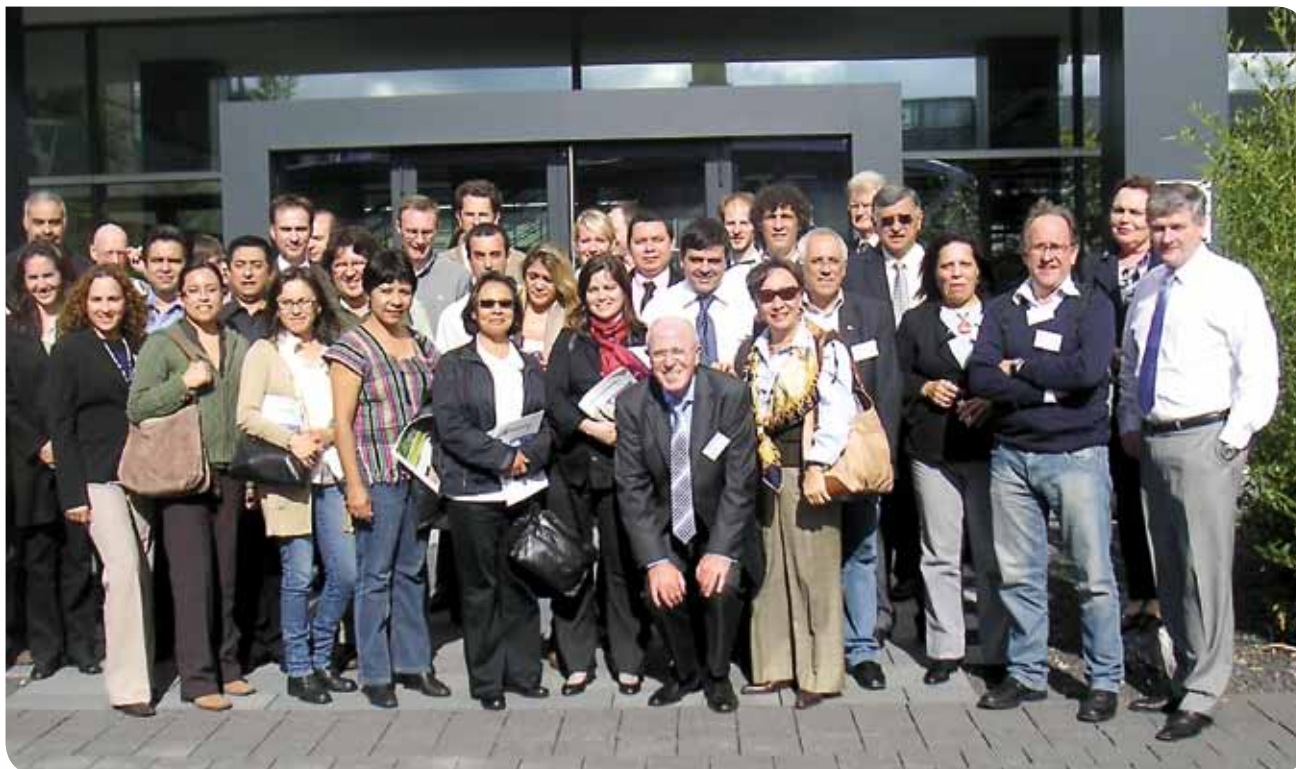
Teilnehmer des Innovationsforums Aachen auf der Biotechnica 2010 in Hannover

„Wir freuen uns, dass die deutschen Gastgeber eine echte Partnerschaft mit uns suchen, eine Partnerschaft, aus der beide Seiten Nutzen ziehen und innerhalb dieser beide wachsen können.“